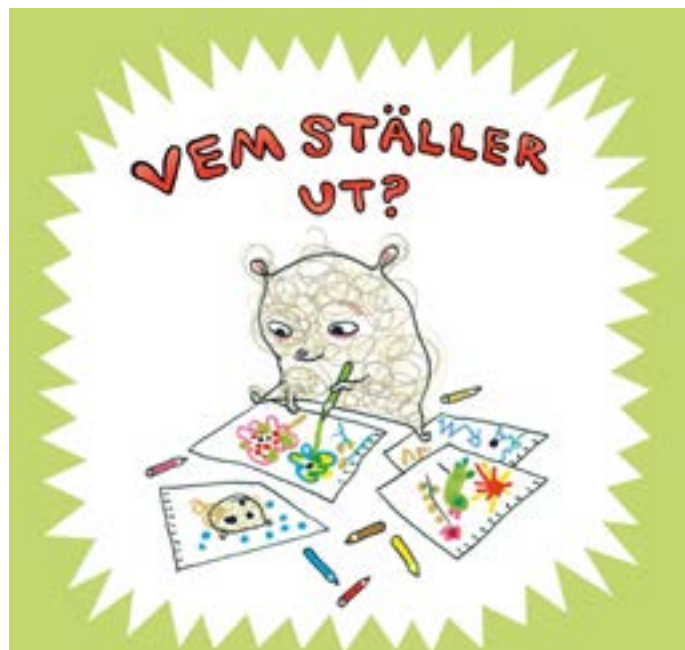
Stina Wirsén är illustratören bakom bland andra böckerna om Nallegrisen. Nu kan du besöka en utställning på biblioteket med hennes bilder, lekmiljöer, tecknad film och böcker. Illustration: Stina Wirsén

Avvikande öppettider: skärtorsdag 28/3 10-16, långfredag-annandag påsk 29/3 - 1/4 stängt, Valborgsmässoafton 30 april 10-16