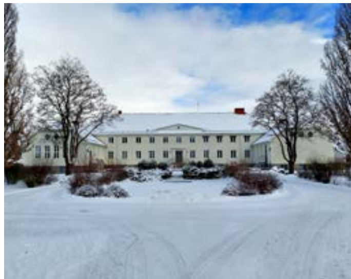
Den 26 mars är det dags för Seniordagen på Vara folkhögskola. Det kommer finnas ett 30-tal utställare och alla intresserade är välkomna.

Utställarna kommer finnas i gymnastiksalen och i samlingsalen i den andra ändan av huvudbyggnaden kommer det